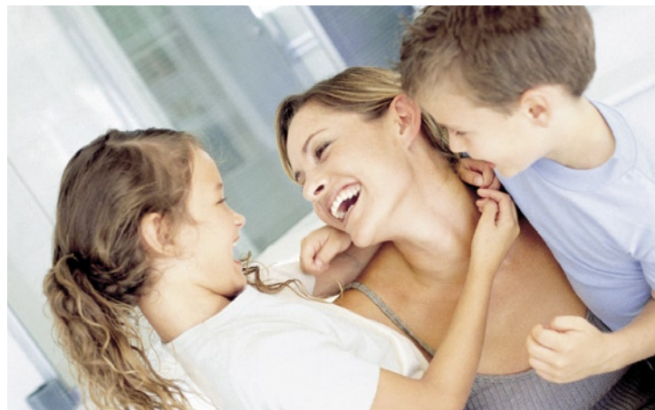
Familie: Früher Start sichert hohe Erträge

Besonderer Clou: Wer mit Riester-Fonds spart, darf nicht nur hohe Renditen erwarten, sondern engagiert sich zudem ohne Verlustrisiko. Am Ende der Sparzeit müssen die Fonds nämlich mindestens die eingezahlten Beiträge sowie die staatlichen Zulagen auszahlen. Da