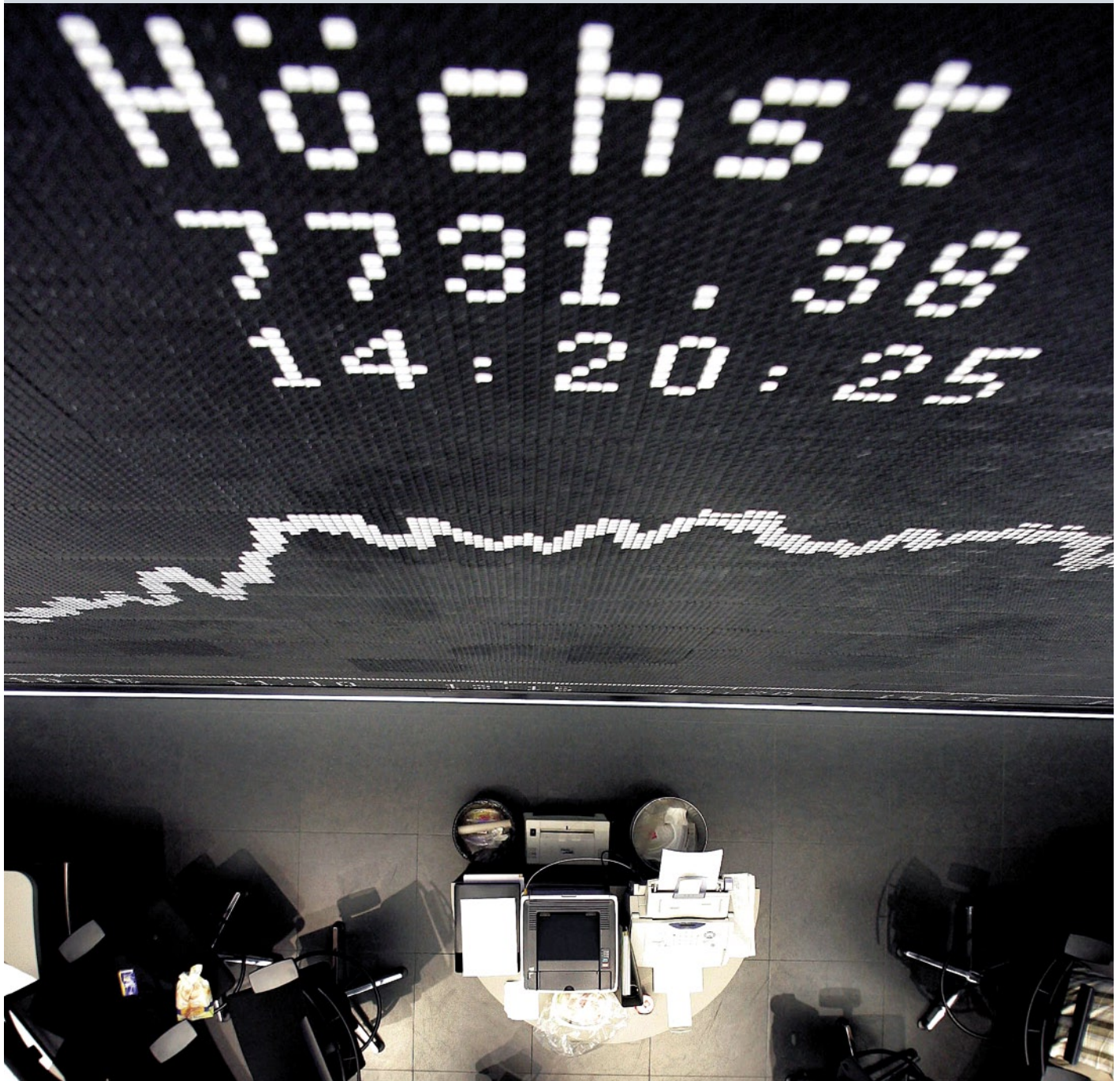
Börsenmakler in Frankfurt: lukratives Sparen mit Aktien

Im Test: Riester-Sparpläne der Fondsgesellschaften. Warum sie die höchsten Renditen bringen